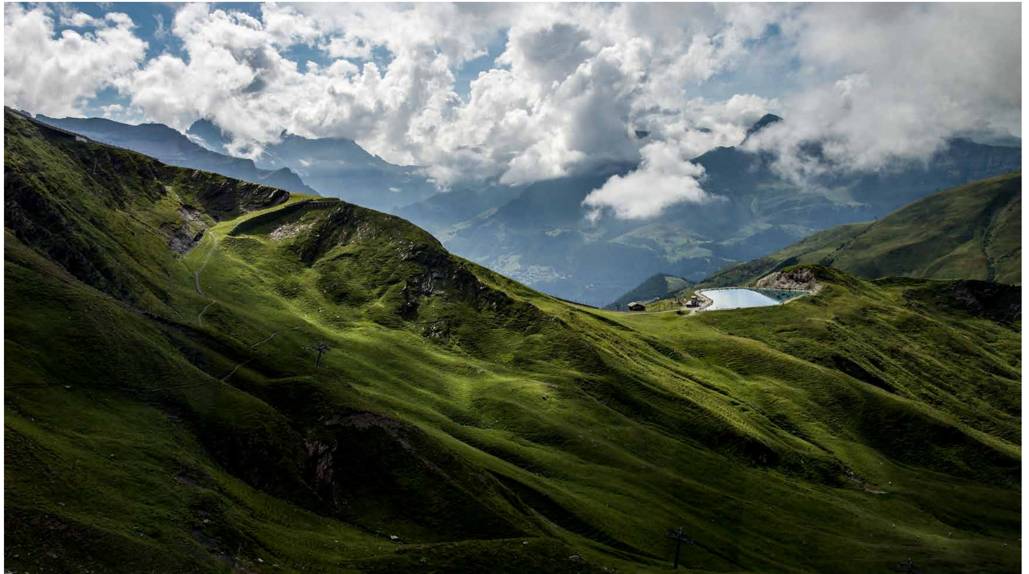
Die „Kleine Scheidegg“ in der Eiger-Mönch-Jungfrau-Region in der Schweiz