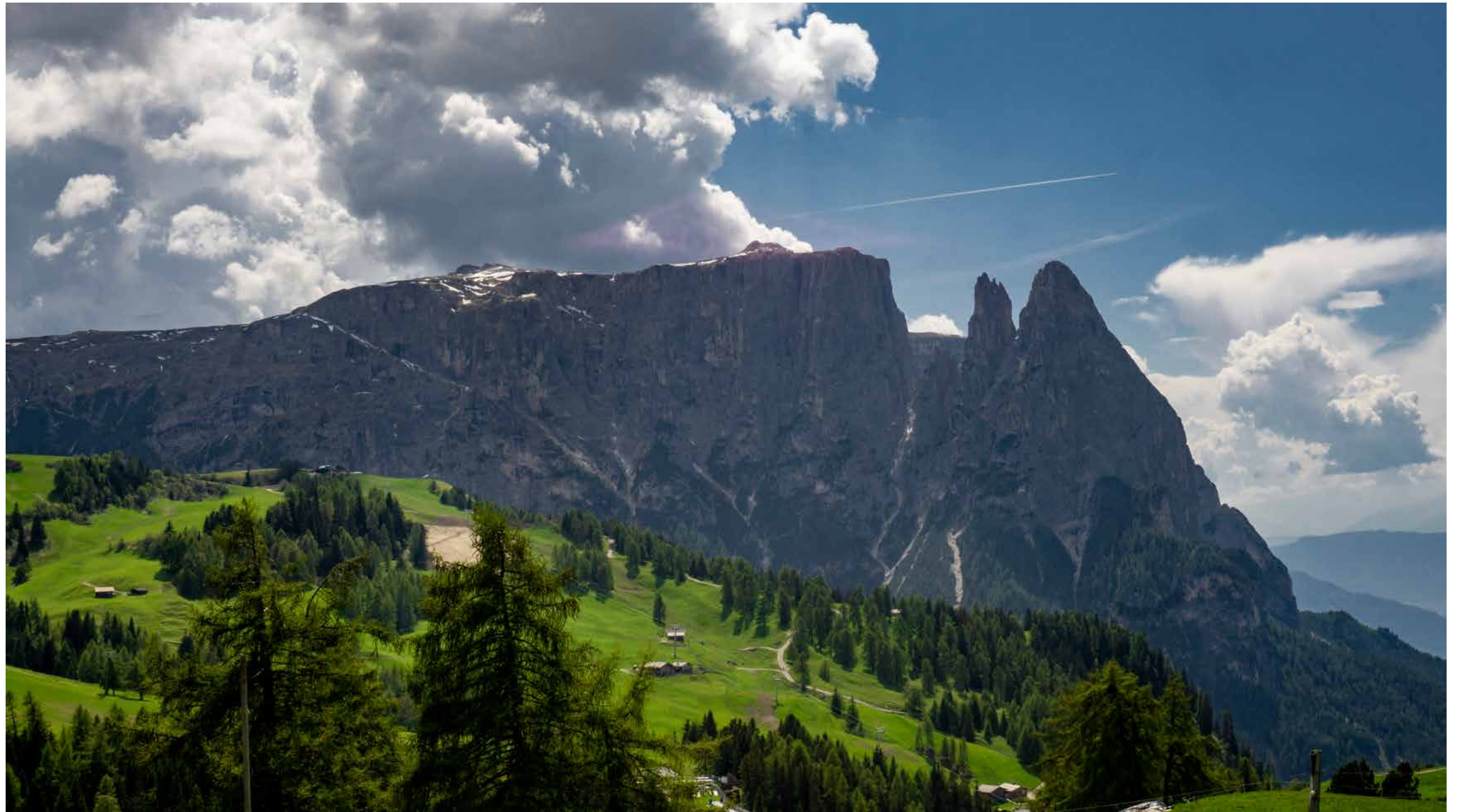
Blick von der Seisser Alm auf den Schlern mit der Santner Spitze