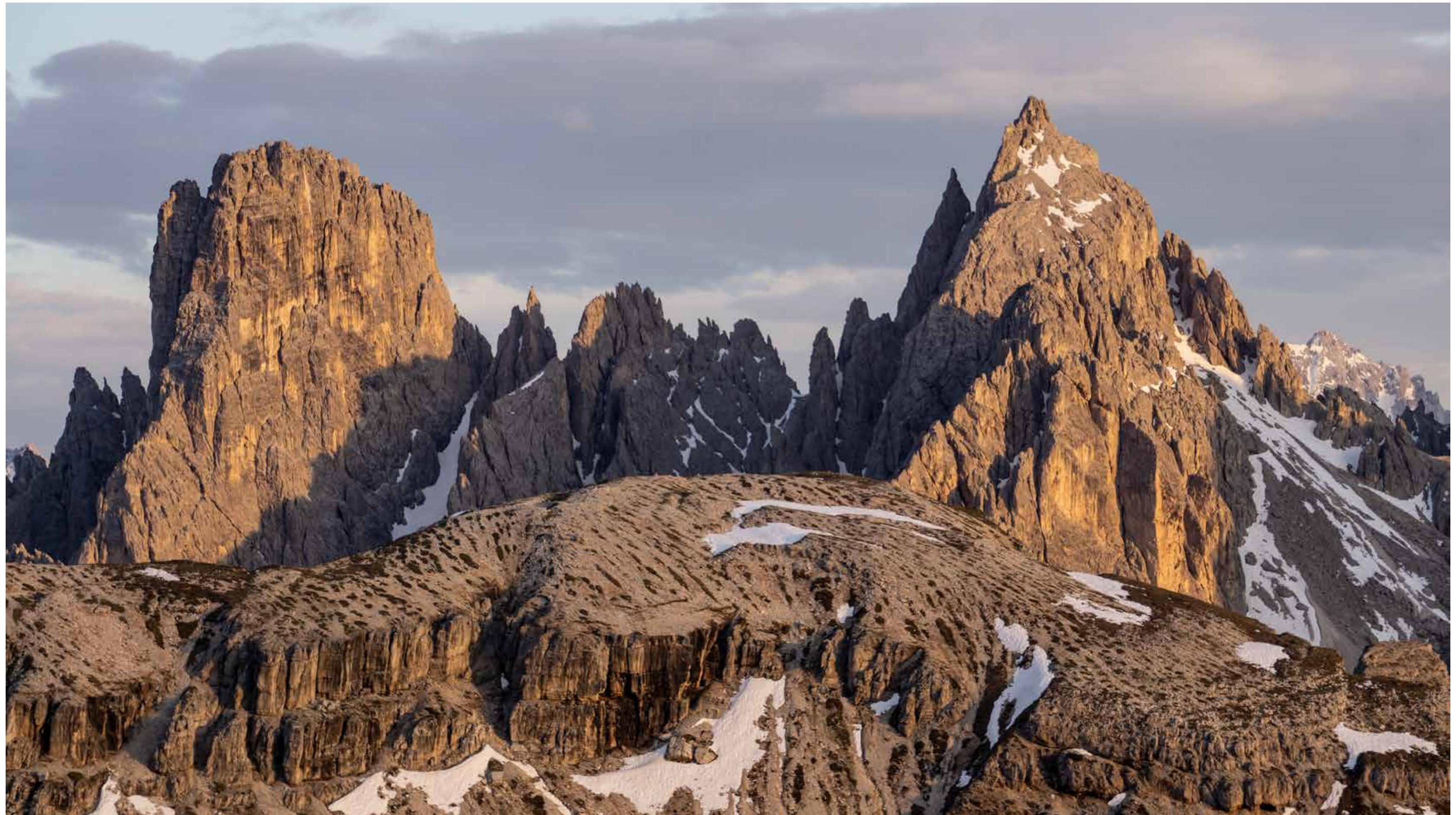
Eine Steinwüste aus bizarren Formationen – „Ciadin del deserto“ – im Gebiet der Drei Zinnen in Südtirol