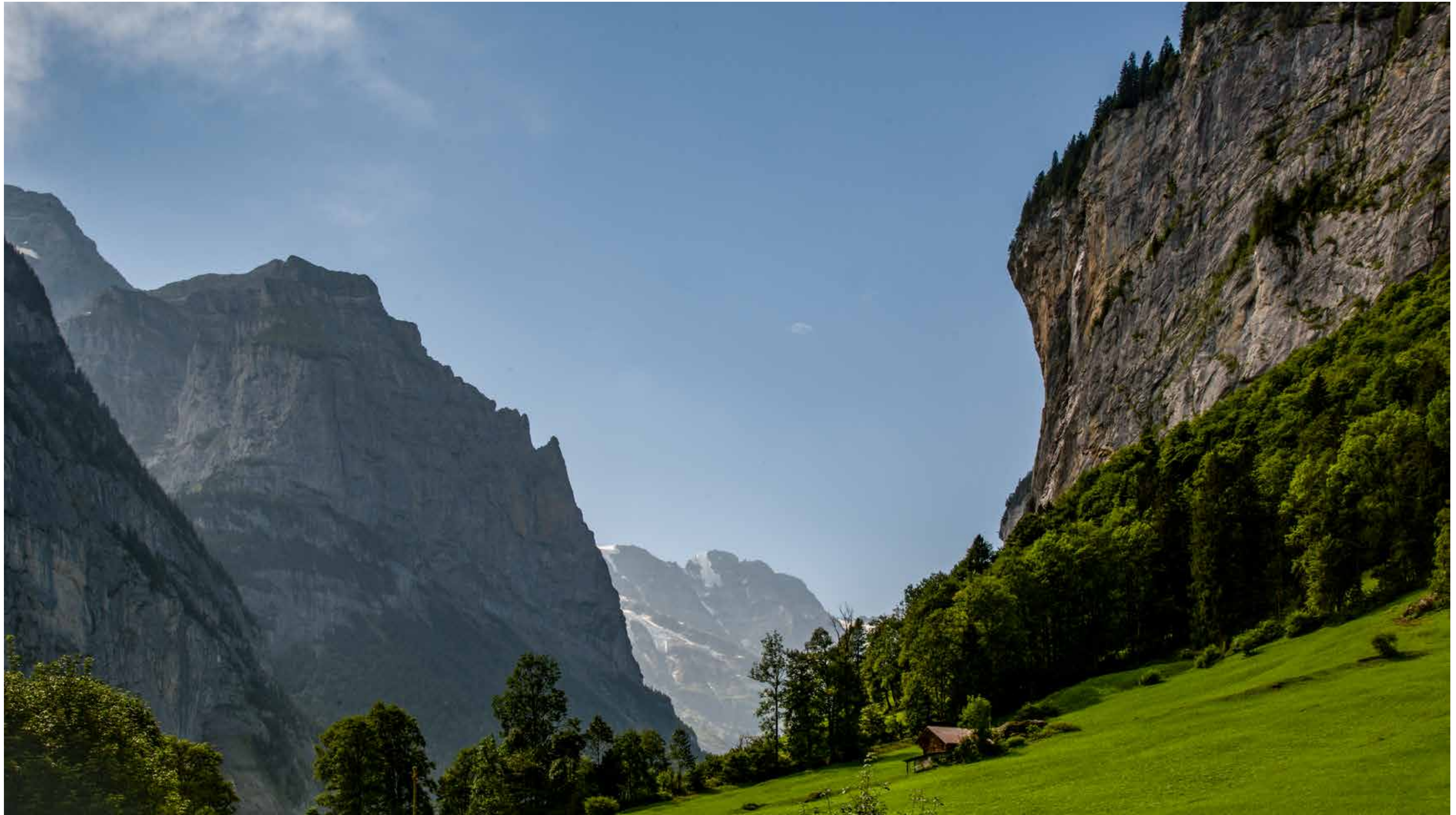
Das Lauterbrunner Tal in der Schweiz mit seiner Enge und den steil abfallenden Felswänden ist Paradies und gleichzeitig Hölle für Base-Jumper. Darüber hinaus sind 72 Wasserfälle die eigentliche und bleibende Attraktion