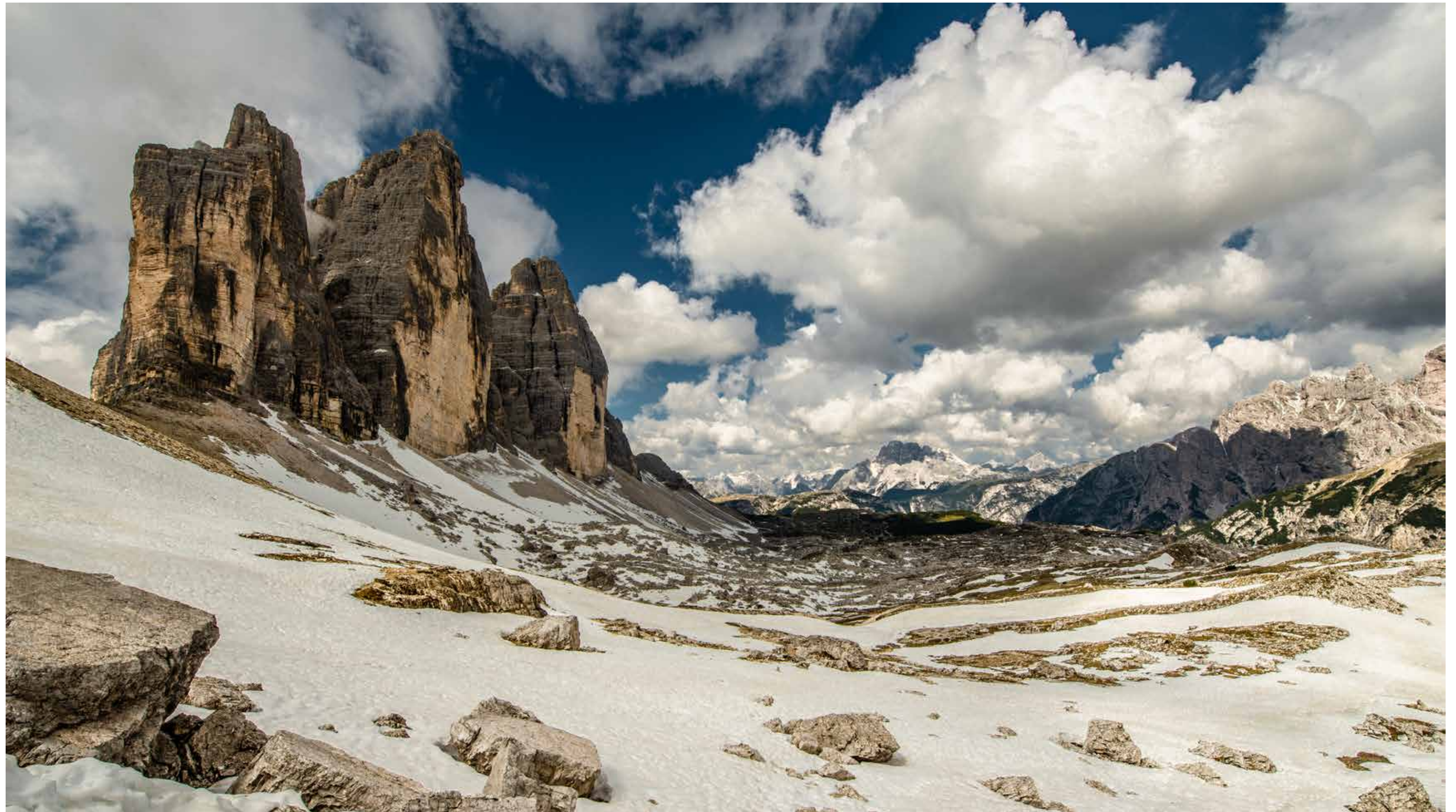
Blick aus östlicher Richtung auf das Weltnaturerbe, die Drei Zinnen