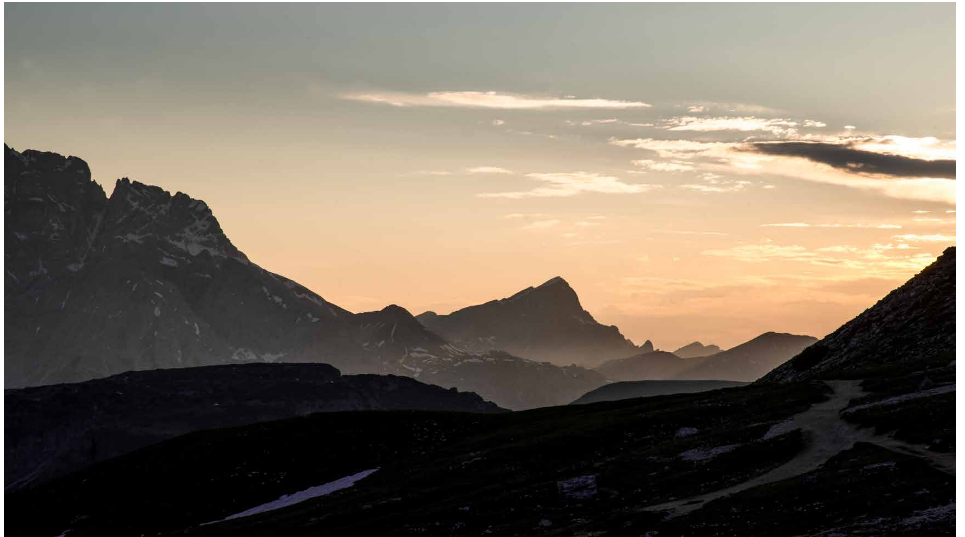
Es sind immer wieder die Weite, die Anmut, das Licht und die Mächtigkeit der Berge, die einfach fesselnd sind.