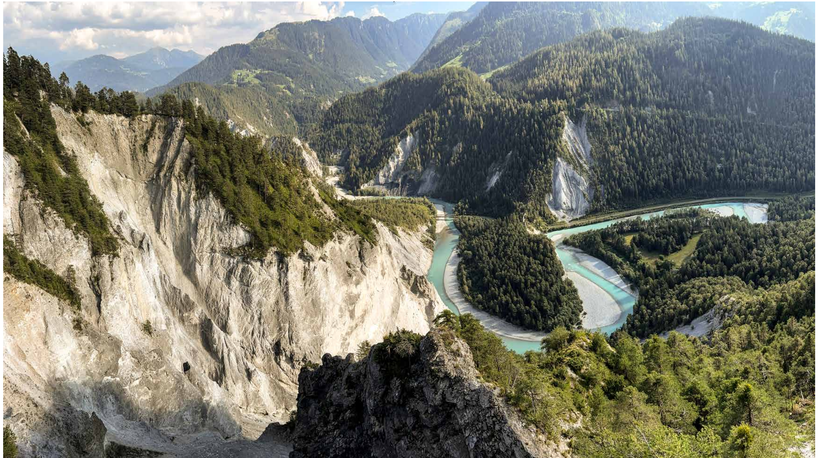
Die Rhein-Schlucht in der Schweiz. DER „Deutsche Fluss“ in seinem „Kinderflussbett“ in der Nähe von Flims im Kanton Graubünden