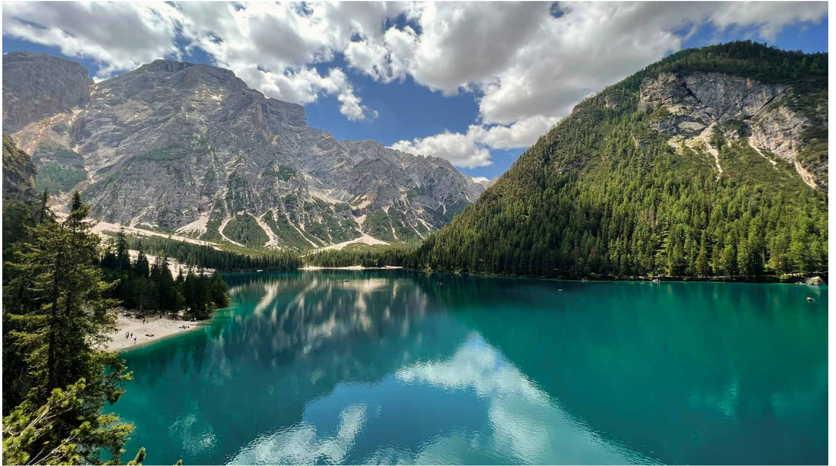
Der Pragser Wildsee in Südtirol