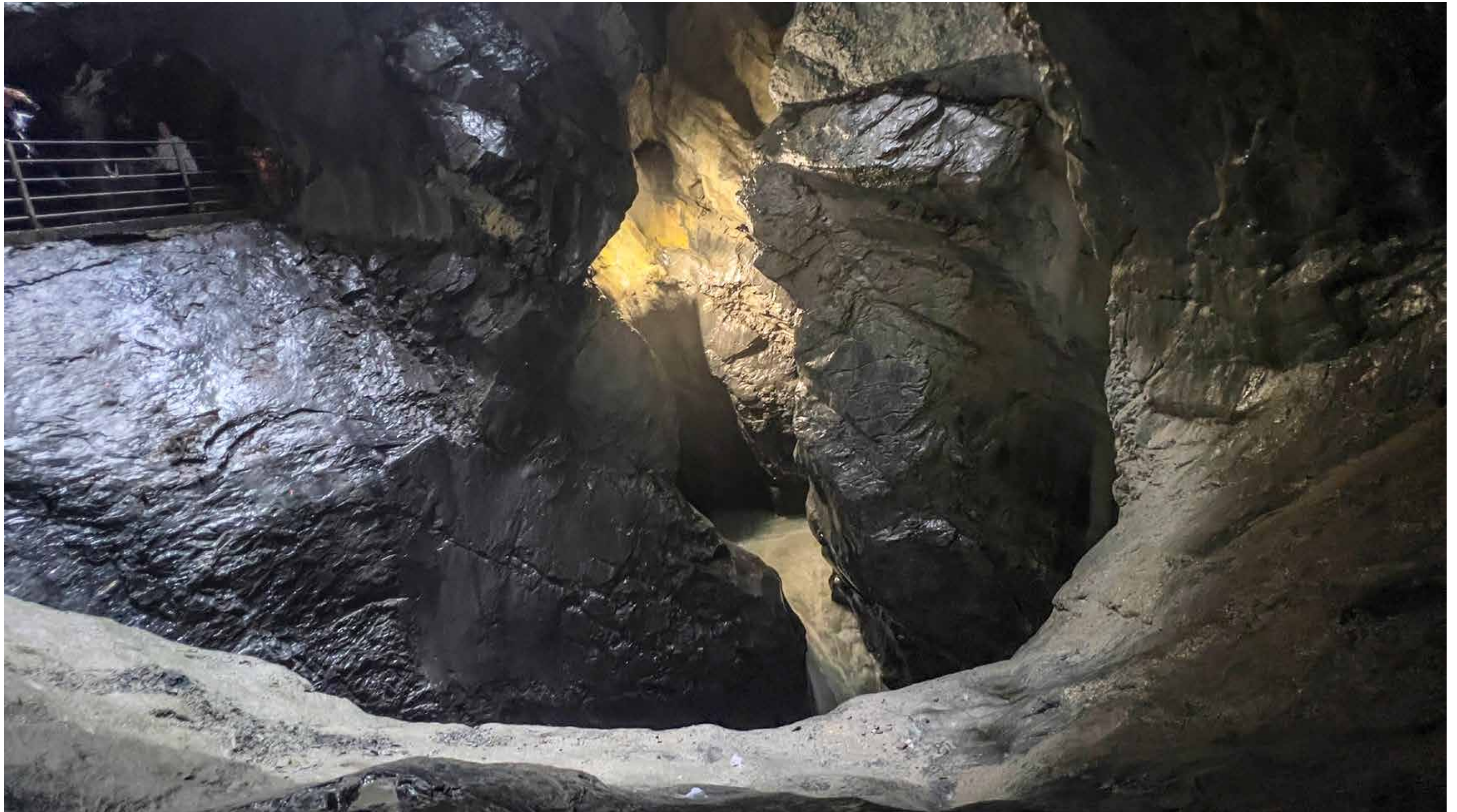
Die Trümmelbach-Wasserfälle im Lauterbrunner Tal entwässern die Gletscher von Eiger, Mönch und Jungfrau durch ein unterirdisches Höhlensystem, das sich das Wasser in Millionen Jahren gegraben hat.