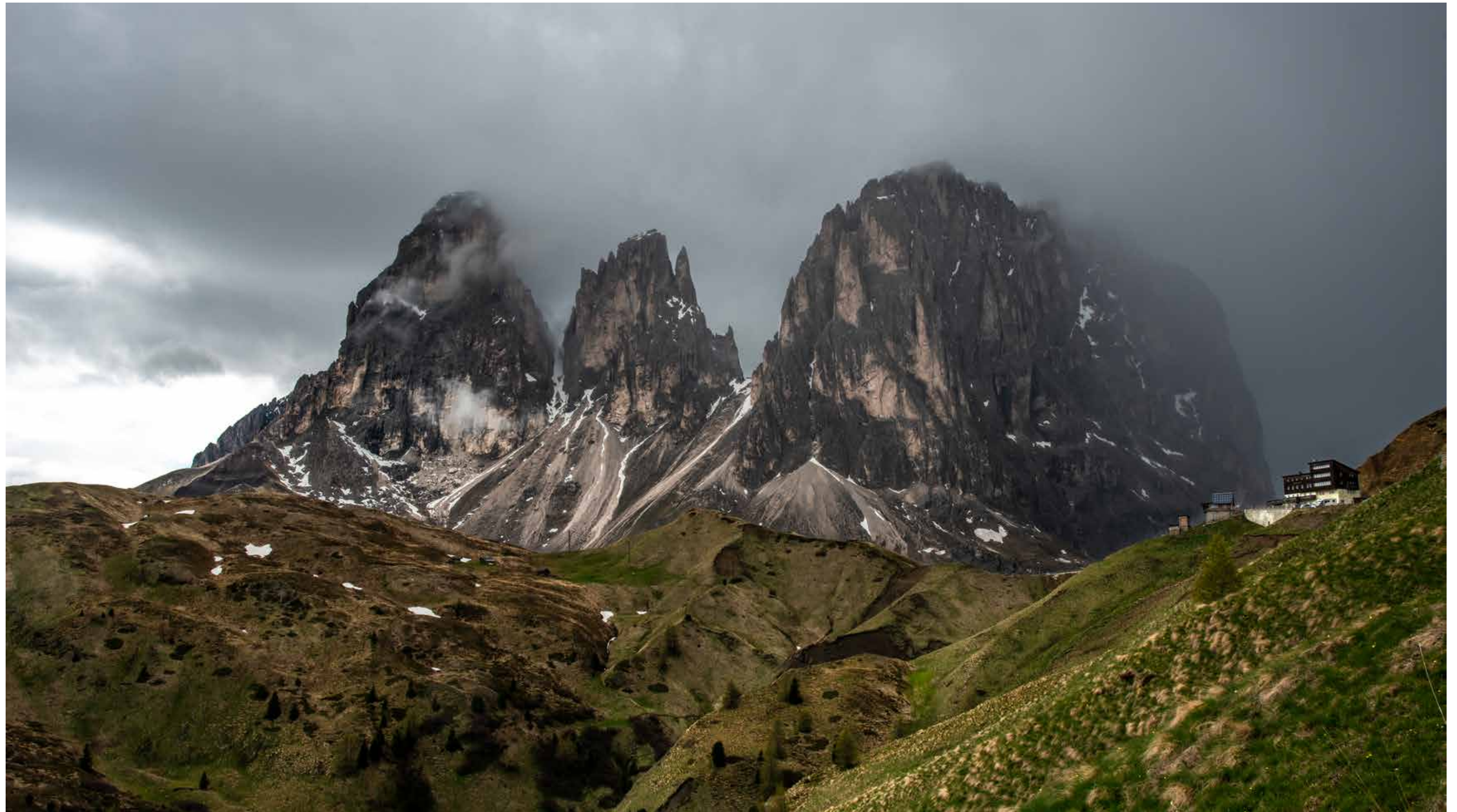
Die Langkofelgruppe in den Dolomiten, Südtirol