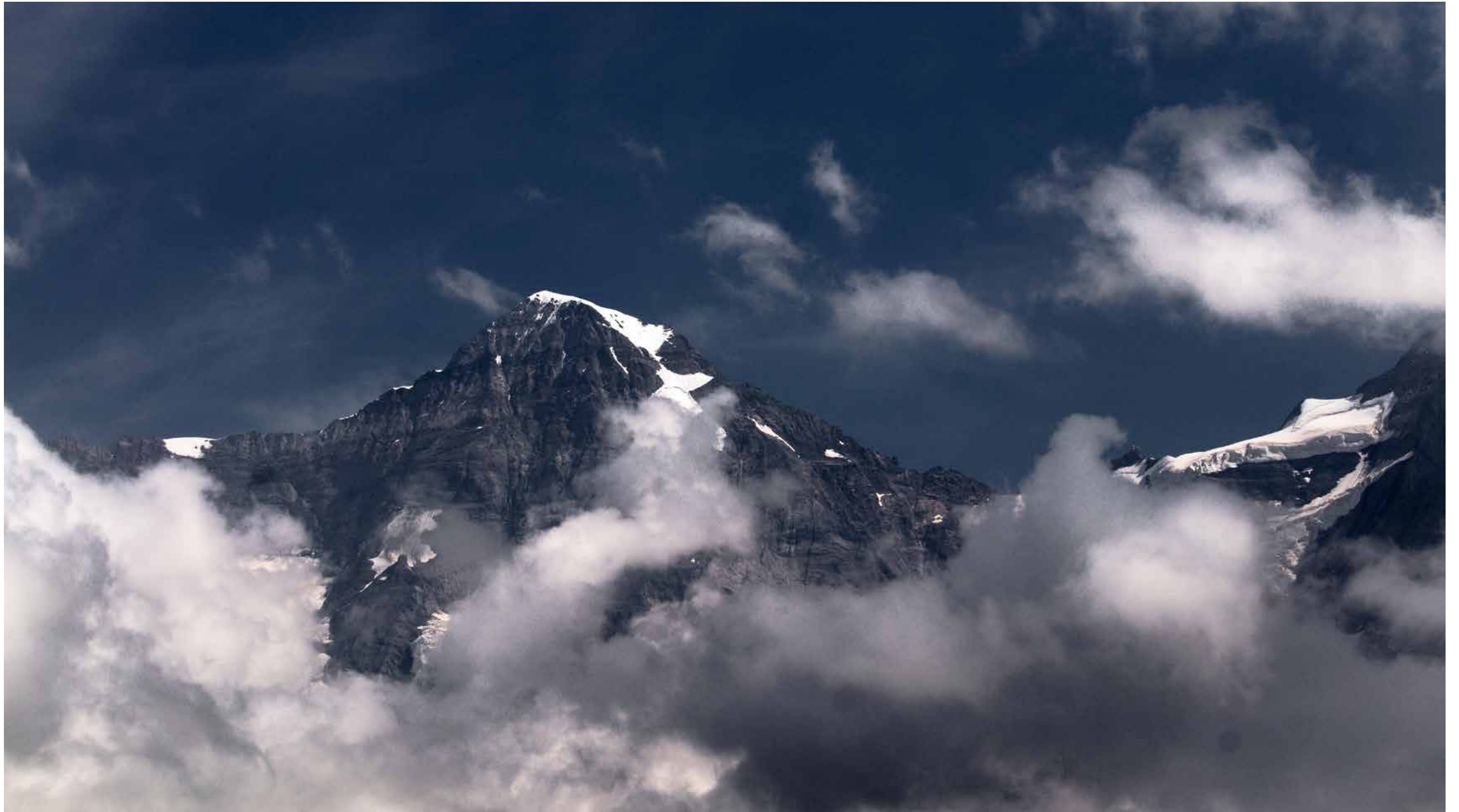
Der Gipfel des Mönch in der Schweiz, eingebettet in Wolken