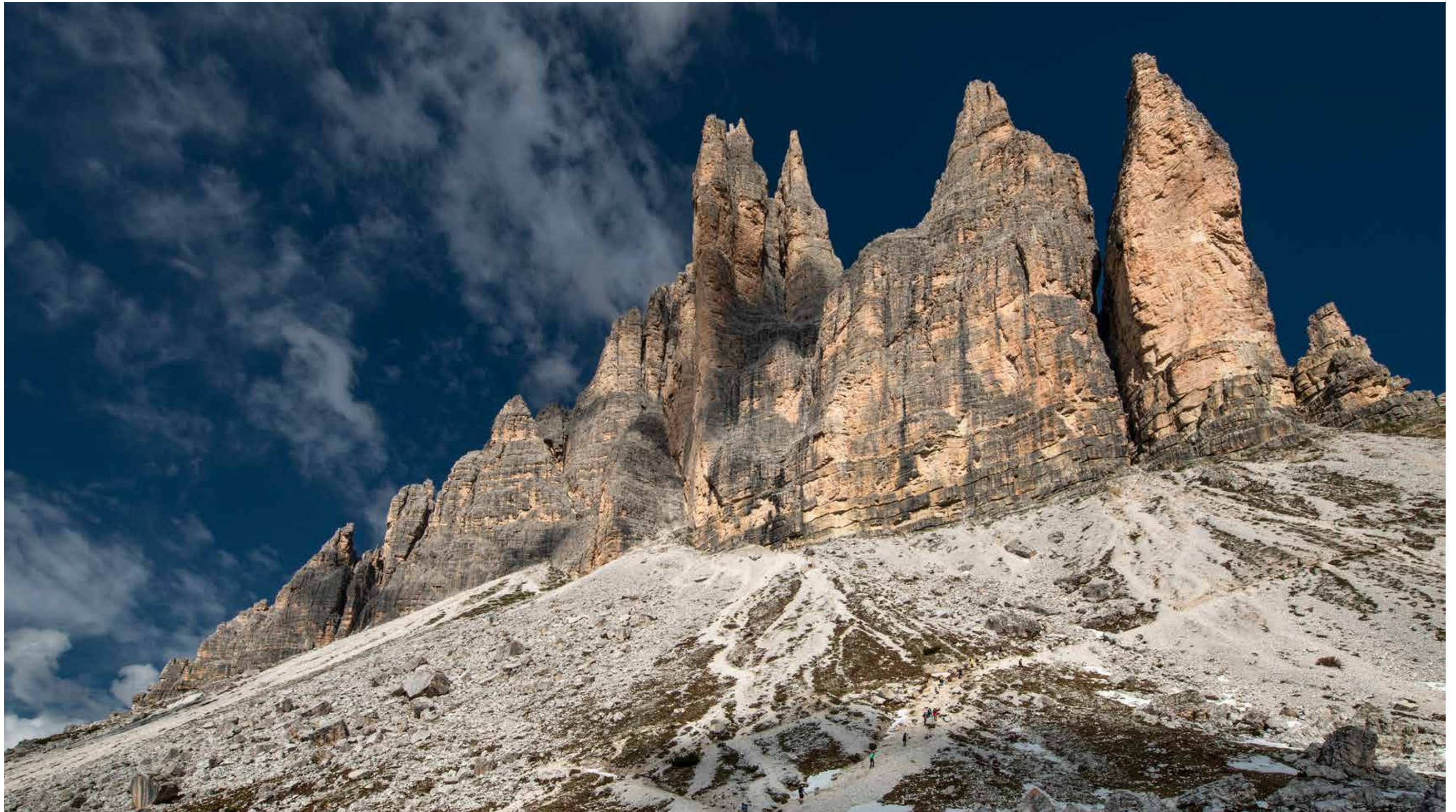
Die Südseite der Drei Zinnen in den Dolomiten